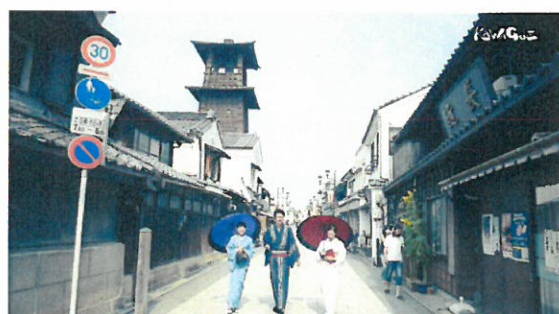
PR動画のイメージ画像