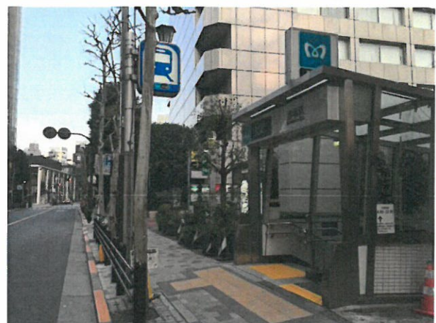
千代田線赤坂駅6番出入口付近