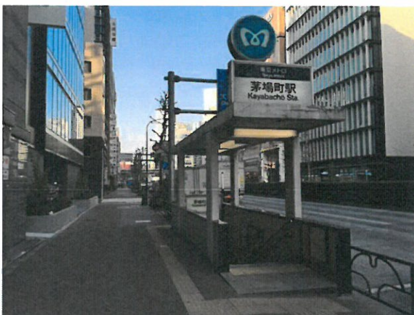
日比谷線茅場町駅2番出入口付近

「駅周辺開発における公募型連携プロジェクトの詳細」は、別紙のとおりです。 皆様のご提案をお待ちしております。