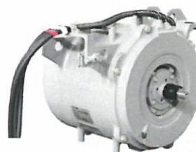
図2 「1000系」用全閉自冷式永久磁石同期電動機