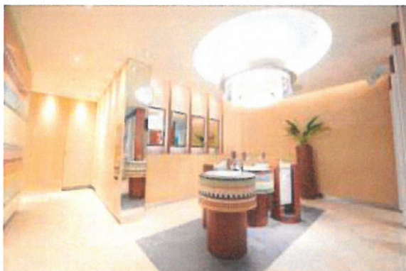
渋谷ヒカリエ ShinQs 「スイッチルーム」

※トイレ、授乳室に加え女性パウダールーム、男性ドレッシングルーム、ベビールーム、コンシェルジュが常駐するラウンジ。