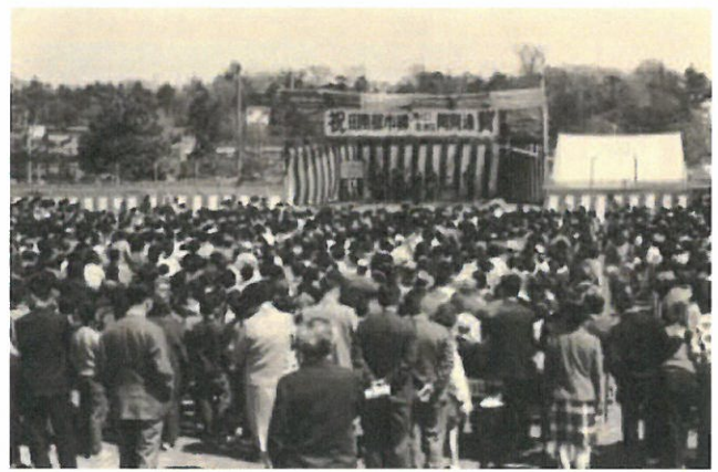
二子玉川園での開通祝賀式の様子