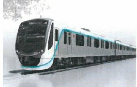
エクステリアイメージ