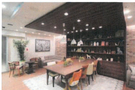
渋谷ちかみちラウンジ