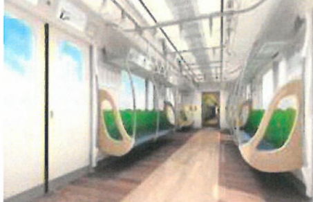
インテリアイメージ