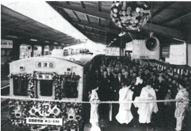
溝の口駅における田園都市線延長線開通式

様々な世代がいきいきと安心、快適に暮らしていくために沿線の生活環境のさらなる質の向上を図っています。