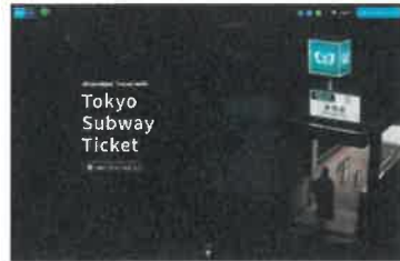
「Tokyo Subway Ticket」専用サイト