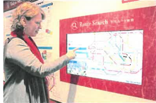
ルート検索ディスプレイ操作イメージ