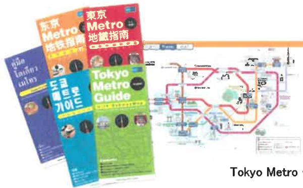
Tokyo Metro Guide

各種乗車券のご案内や沿線スポットを記載したフリーレットを4か国語（英語、中国語（簡体字・繁体字）、韓国語、タイ語）にて発行し、当社駅をはじめ、羽田空港・成田空港、沿線のホテルなど訪日外国人のお客様との接点となる窓口でも配布を行っています。さらに、Web版ではフランス語、スペイン語にも対応しています。