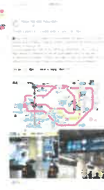
英語版Facebookアカウント 「Tokyo Trip with Tokyo Metro」