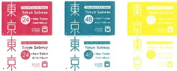
Tokyo Subway Ticket