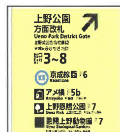
案内サインシステム