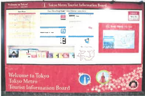
ウェルカムボード(上野駅)

各種乗車券に関する情報、主要な観光スポットへのルートガイドや観光スポット入りの路線図などを掲示するウェルカムボードを14駅に設置し、そのうち11駅に目的地までのルートを検索できるディスプレイを設置しています。ウェルカムボードは、3か国語(英語、中国語(簡体字・繁体字)、韓国語)に対応し、ルート検索ディスプレイは、7か国語(日本語、英語、中国語(簡体字・繁体字)、韓国語、タイ語、フランス語、スペイン語)に対応しています。