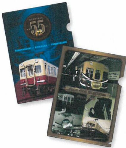
クリアファイル(イメージ)