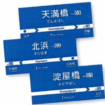
マグネット(イメージ)