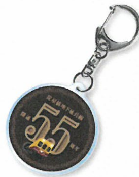
京阪電車オリジナルキーホルダー(イメージ)