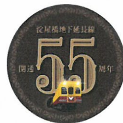
特製ヘッドマーク(イメージ)