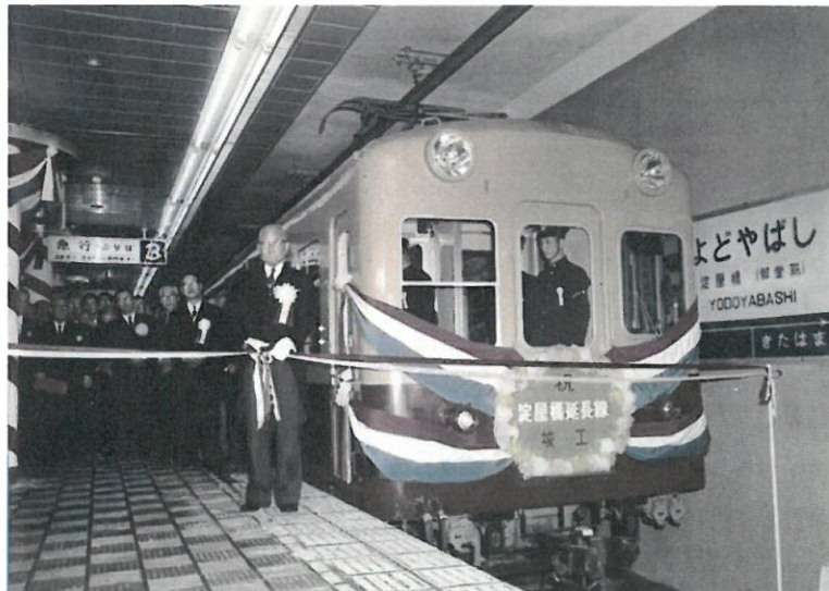
淀屋橋地下延長線竣工当時の様子