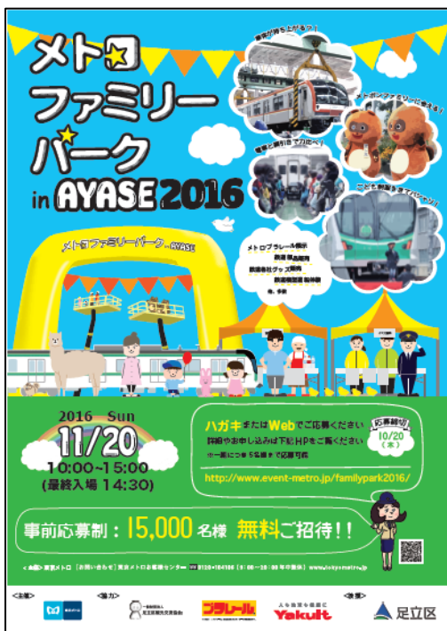
ポスターデザイン