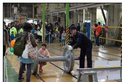
「ぐるっと車輪くん」