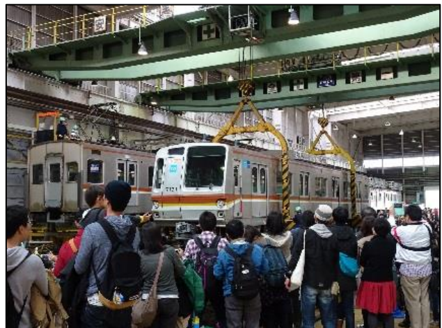
大きな車体が吊り上げられる迫力を体感できる 「車体吊り上げ実演」

※このニュースリリースは、国土交通記者会、ときわクラブ、都庁記者クラブ、レジャー記者クラブにお届けしております。