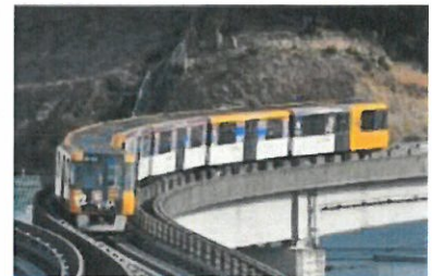
【サンフレッチェ・応援トラム】

明日に向かって、アストラムラインは今日も走ります。何よりも大きな「安心」を乗せて