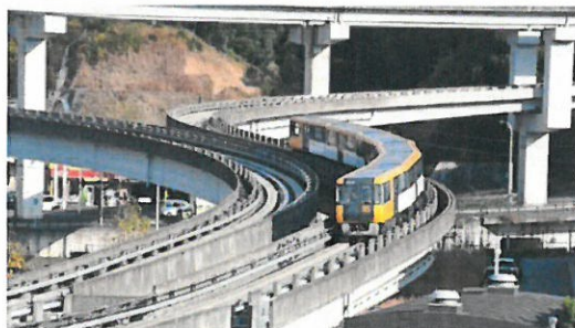
引込線を下るアストラムライン【イメージ】