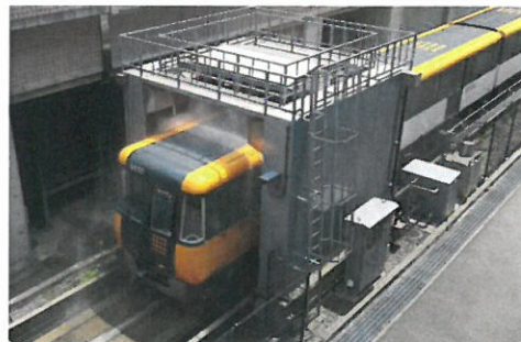
車両洗浄【イメージ】