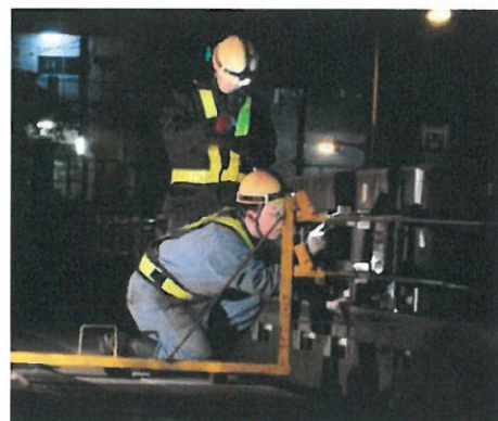
深夜の保守作業【イメージ】