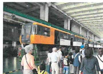
検車棟の見学【イメージ】

普段は公開していない検車棟や入出庫線などの見学とアストラムラインの解説を行います。停車中のアストラムラインをバックに写真撮影はいかがですか？